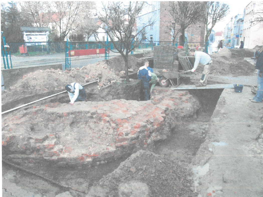
Odkryty fragment baszty barbakanu Bramy Lubawskiej od strony południowej części ul. 3 maja, w okolicy sklepu „Netto”