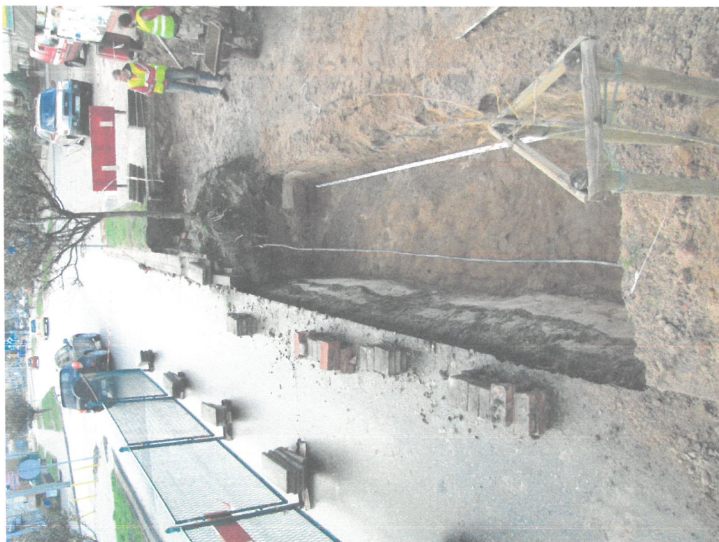
Wykop sondażowy w północnej części ul. 3 maja – sąsiadującej z Ogrodem Róż – fragment zniszczonego współcześnie (prawdopodobnie w latach 90-tych) fragmentu muru średniowiecznej szyi bramnej łączącej Bramę Lubawską z kolistą basztą barbakanu