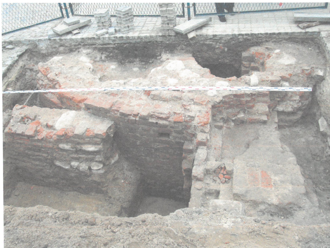
Odkryty fragment baszty barbakanu Bramy Lubawskiej od strony Ogrodu Róż przy ul. 3 maja

Wyniki badań: Weryfikacyjne badania archeologiczne w strefie przedbramia i strefy baszt barbakanu przy baszcie Bramy Lubawskiej w Nowym Mieście Lubawskim pozwoliły odsłonić dwie bliźniacze, koliste baszty tworzącymi rodzaj barbakanu. Ponadto na kilku odcinkach odkryto fragmenty murów szyi bramnej łączącej Bramę Lubawską ze wspomnianym barbakanem, dzięki którym udało się ustalić jej przebieg. Mapę z oznaczonymi miejscami odkrytych reliktywów średniowiecznej architektury na ul. 3 maja dołączono do niniejszego programu badań (załącznik nr 2).