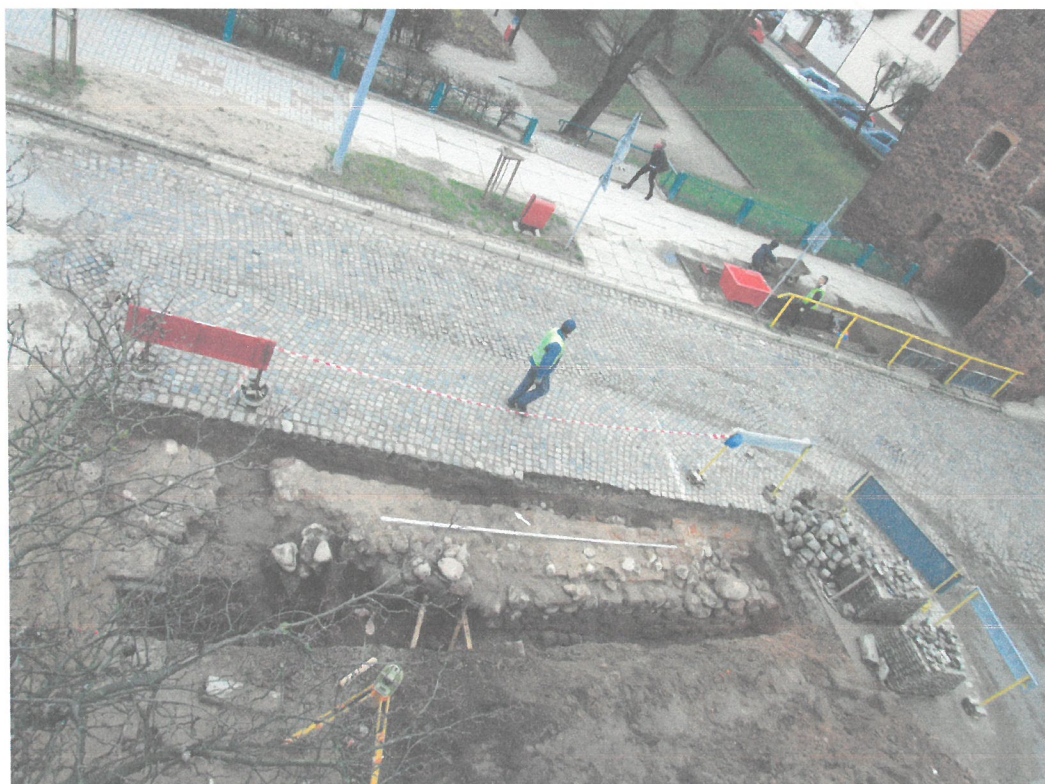
Odkryty fragment szyi bramnej Bramy Lubawskiej od strony południowej części ul. 3 maja, w okolicy sklepu „Netto”