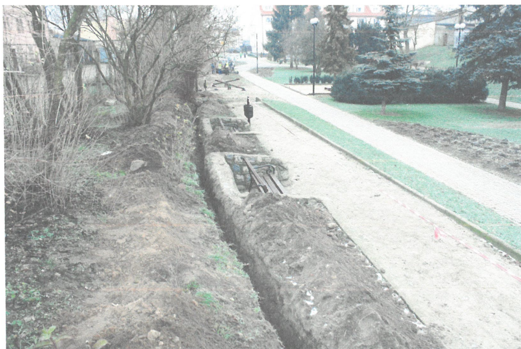
Widok ogólny przeprowadzonych prac ziemnych -wykopy pod kable elektryczne.

Wyniki badań: Wykopy sięgały głębokości około 0,4 m. Warstwy odkryte były głównie warstwami nawiezionymi podczas zagospodarowywania przestrzeni ogrodu miejskiego. Nie zarejestrowano pozostałości warstwy kulturowej czy luźnych zabytków archeologicznych.