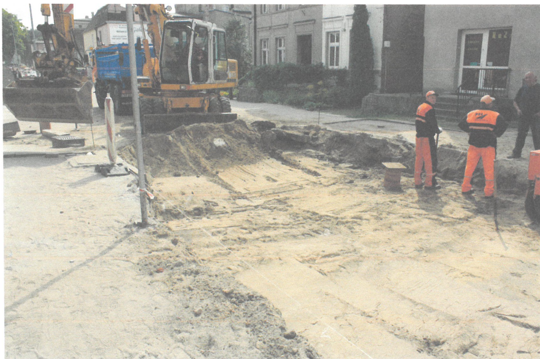
Wymiana nawierzchni ulicy - ulica Działyńskich