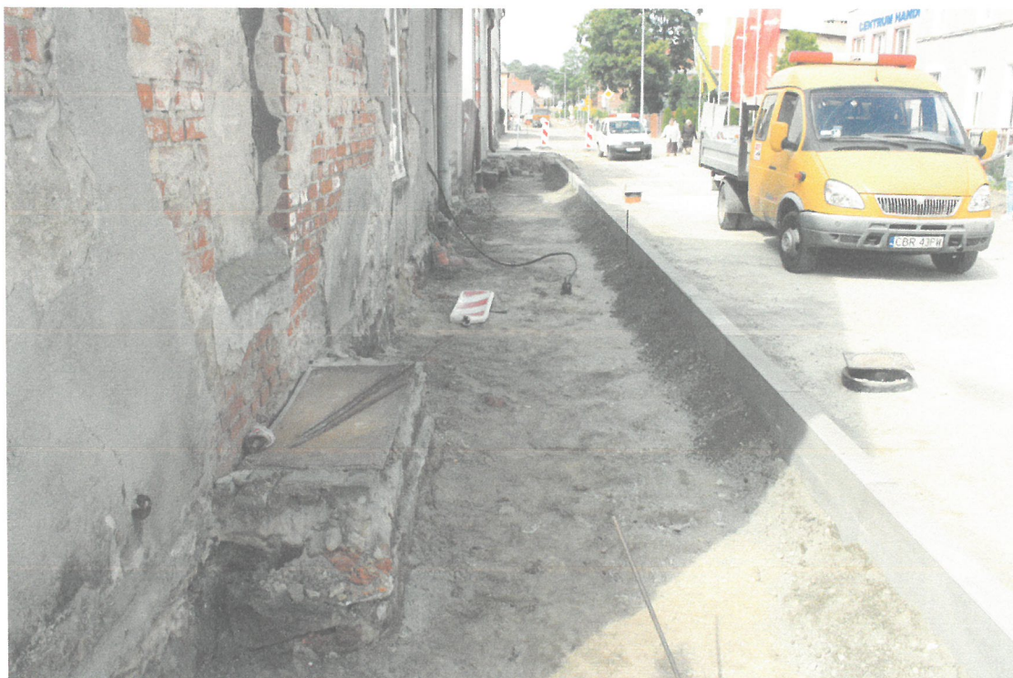
Wymiana nawierzchni chodników - ulica Działyńskich