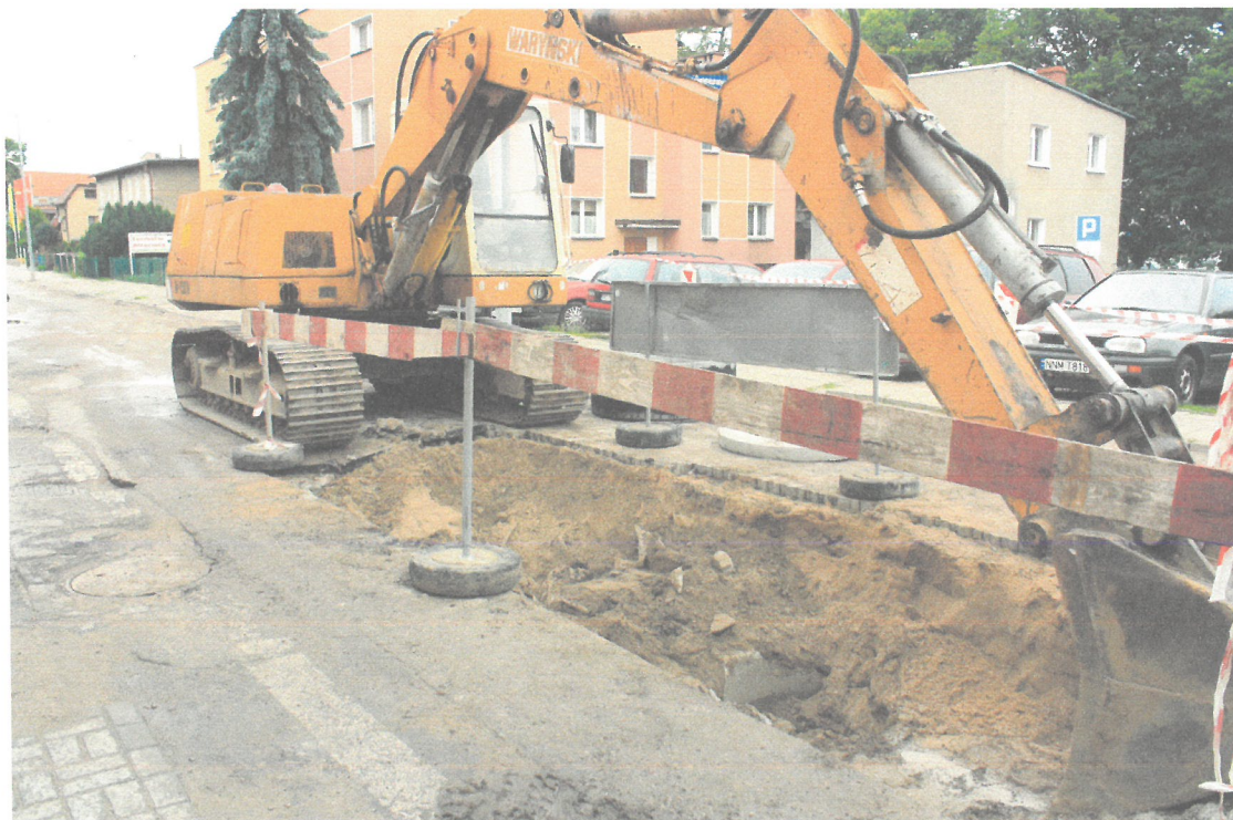
Wymiana kanalizacji deszczowej - skrzyżowanie ulicy Działyńskich z ulicą Kazimierza Wielkiego

Wyniki badań: Podczas wymiany kanalizacji deszczowej w obrębie ul. Działyńskich zarejestrowano warstwy nasypowe, nawiezione w latach 90-tych podczas pierwszej instalacji urządzeń sanitarnych. Ponadto wymieniono nawierzchnie chodników. Nie zarejestrowano tu naturalnego układu warstw. Nie zarejestrowano tu pozostałości architektury czy zabytków archeologicznych. Warstwy odkrywane to żółty sypki piasek bez zawartości kulturowej, będący zasypiskiem po wykopach wykonanych wcześniej.