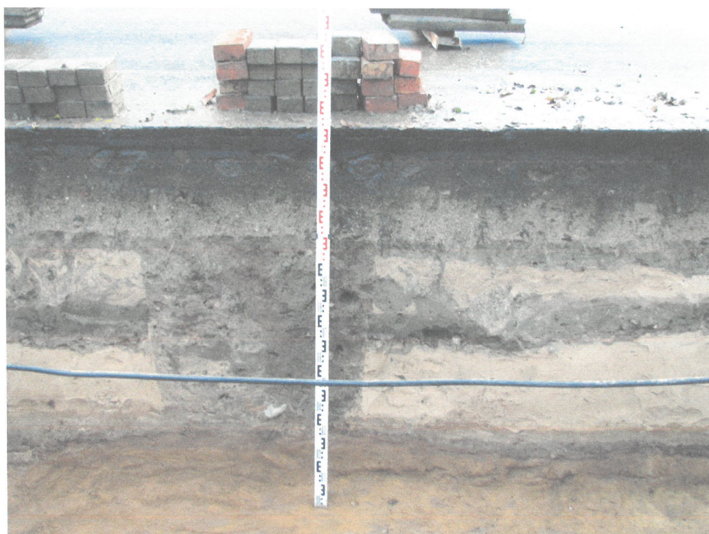
Wykop sondażowy w północnej części ul. 3 maja – sąsiadującej z Ogrodem Róż – ślady po wkopach współczesnych